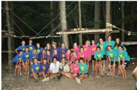
Plast "junatstvo" at the Pysanyi Kamini camp in Middlefield, Ohio.

Plast in the United States marks the summer months with a variety of camps in a range of locations. The main component of Plast's summer program is a three-week camp for children ages 8-11 (novatstvo) and 11-17 (junatstvo) with additional programs for parents and children under age 6 (Tahir Plashka) and older junatstvo. These camps will take place from July 7 to July 28 at three different campgrounds: Novyi Sivil in North Collins, N.Y. ( www.novysivil.org ); Pysanyi Kamini in Middlefield, Ohio ( www.plastoleland.org/plastplk0m ); and Yevcha Tropia in East Chatham, N.Y. ( www.yevchatropia.org ).