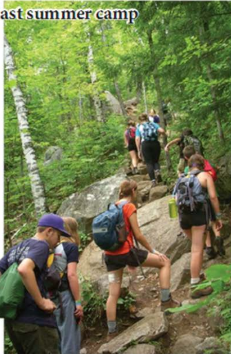
A group of participants of the International Plast Jamboree of 2011 hikes in the Adirondack Mountains of New York state.