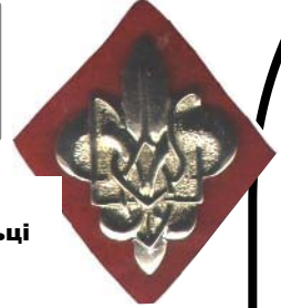
МАЛА ЛІЛЕЙКА на малиновому фільці (після I проби)